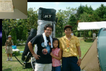
星をもとめて 2001年にも参加しました。